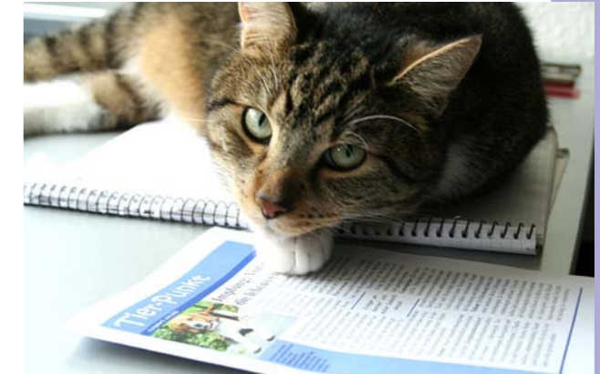
Kater Elvis ist noch häuslicher geworden.

Da ich bei einem größeren Ausflug von unserem unliebsamen Nachbarskater „vermöbelt“ worden bin und mich der Tierarzt erst einmal krank schreiben musste, war ich in meinem geliebten Garten einige Zeit nicht einsatzfähig.